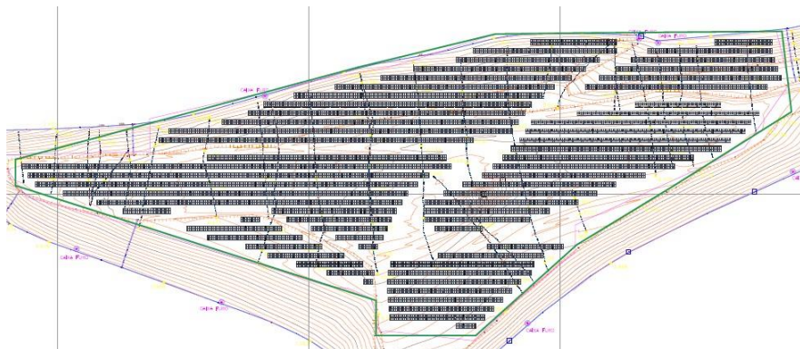
Figura 5 - Delimitação do cercamento da usina FV do Aterro Sanitário de Santa Cruz.

O terreno deverá ser completamente demarcado, utilizando cercas de proteção para restrição de acesso de pessoas não autorizadas tanto durante, quanto após as obras, conforme delimitação indicada no Apêndice 4.