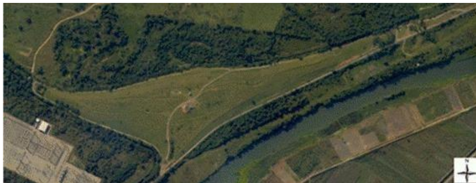
Figura 1 - Registro de satélite do Aterro Sanitário de Santa Cruz ( 22^{\circ}52'21.07''S 43^{\circ}42'29.96''O ).

O Aterro Sanitário de Santa Cruz fica localizado na cidade do Rio de Janeiro – Rio de Janeiro, no bairro de Santa Cruz ( 22^{\circ}52'21.07''S 43^{\circ}42'29.96''O ). A Figura 1 apresenta a imagem de satélite do Aterro Sanitário de Santa Cruz.