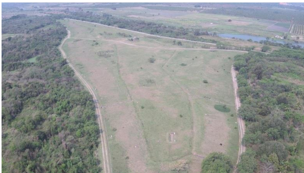
Figura 2 - Registro fotográfico aéreo do Aterro Sanitário de Santa Cruz

A Figura 2 apresenta o registro fotográfico aéreo realizado do aterro, que teve o encerramento de suas atividades em 1999.