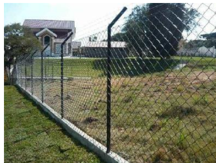
Figura 6 (a+b) - Tipos de cercamento a serem utilizados no aterro (a) Cercamento com moeirão de concreto, (b) Cercamento com coluna em tubo de aço.